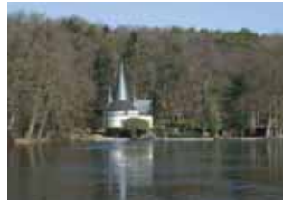
ehemaliges Pförtnerhaus am Raky Weiher

durch Naturschutzgebiet zu (1,5 km) Punkt 76