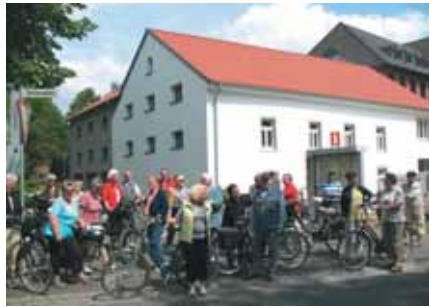
Wegberger Mühle, Touristinformation und Café