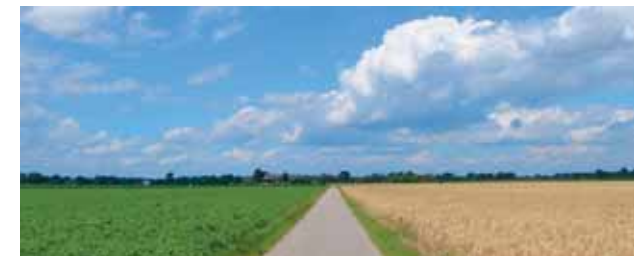
Wanderweg Richtung Klinkum